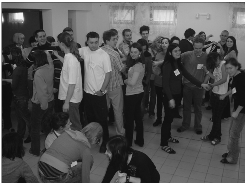
Kortárs segítők találkozója: Szeged-Erdély-Temesvár