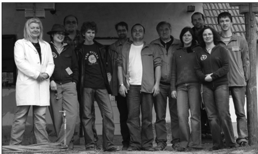
Környezetvédelmi képzések és szakmai találkozók