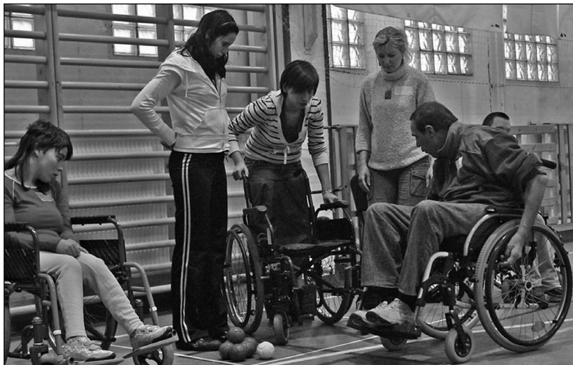
Fogyatékkal élők önkéntes segítése képzés