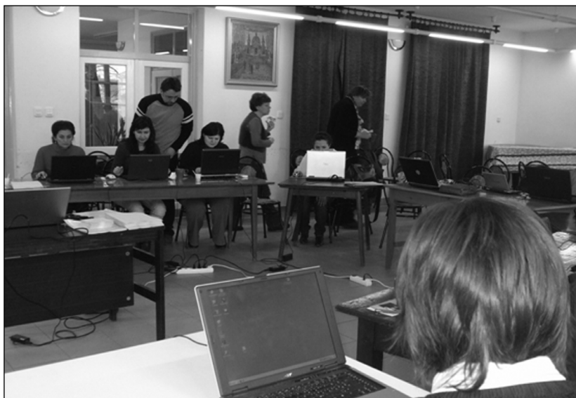
Minőség a civil szervezet életében képzés