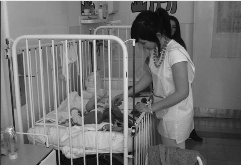
Kórházi önkéntesek képzése