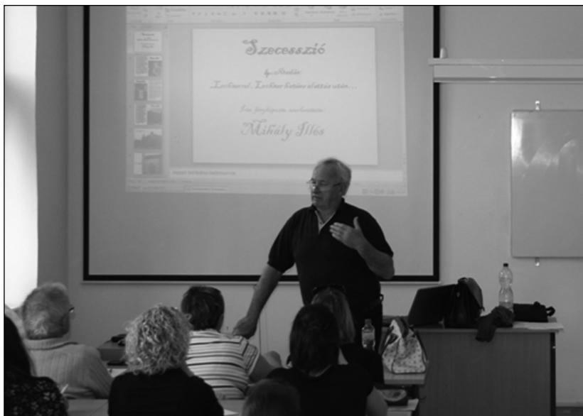
A szegedi idegenvezetők egyesületi továbbképzése: a szecesszió értékei