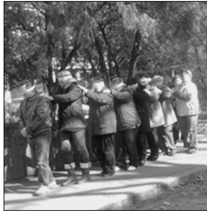
Nevelőszülői komplex tréning KÁSZPEM® Módszerrel Cegléden