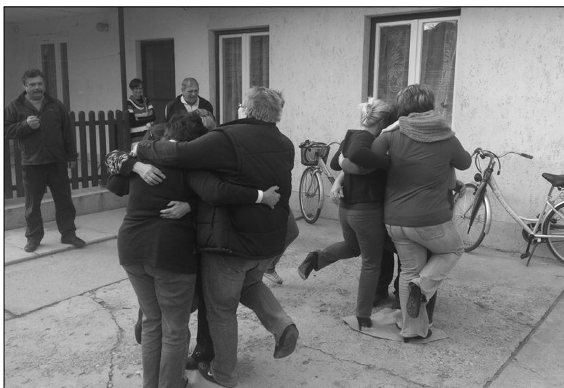
Kiegészítés tréning KÁSZPEM® Módszerrel Békésen