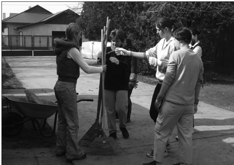
Önkéntes menedzsment képzés