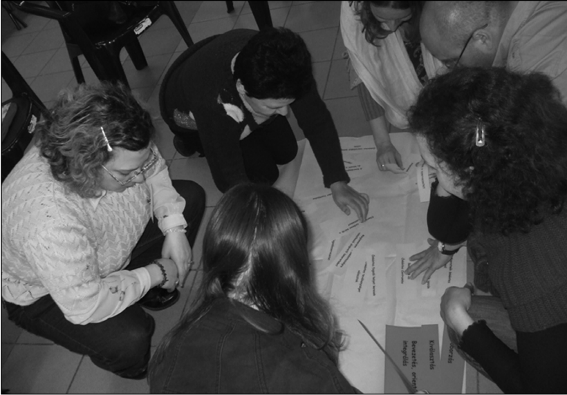
Interaktív szituációs gyakorlatok