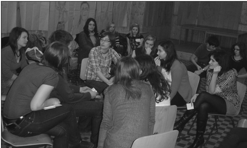
Kortárs segítő képzés Szegeden

Szívesen kapcsolódnak be olyan civil szervezetek munkájába (határon innen és határon túl), amelyekben hasonló típusú tevékenységi területen megvalósulhat az ifjúságsegítő közös tevékenység.