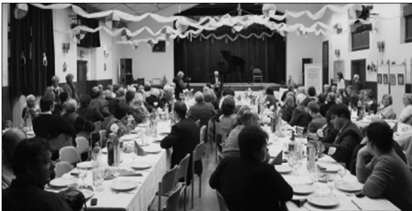
Évzáró a Népfőiskolán

Felnőttképzési programjaik igazi „hungarikumnak” számítanak, hiszen a közös, közvetlen ismeretszerzésre való igény töretlenül megmaradt az internet, a tucatnyi új tévécsatorna mellett is. A helyi közösség erősítése pedig a következő évtizedekben is nemes civil küldetése lesz a Zsombói Népfőiskolának.