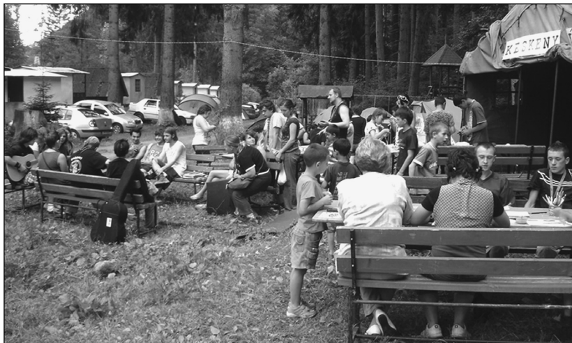
Erdélyi fiatalok a Tusványosi Nyári Szabadegetem és Diáktábor Keskény út Fesztiválmisziós Csoport programján