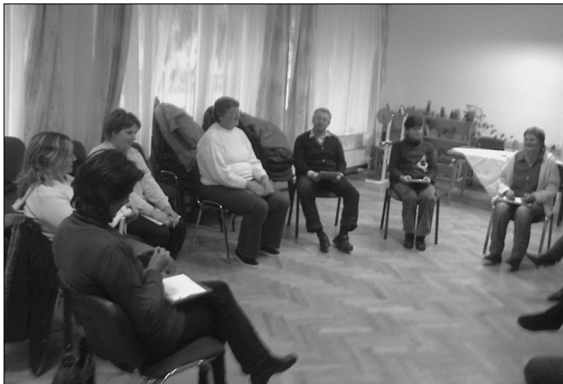
Kiegészítés tréning KÁSZPEM® Módszerrel Szekszárdon