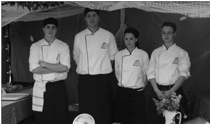
Szakiskolák gasztronómiai versenye

Szociális segítségként az elmúlt tanévben írószer-csomagot, ünneplő/ballagó ruhát biztosítottak.