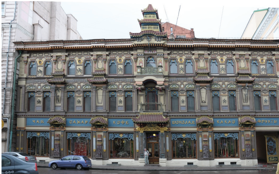
19. sz. fotó