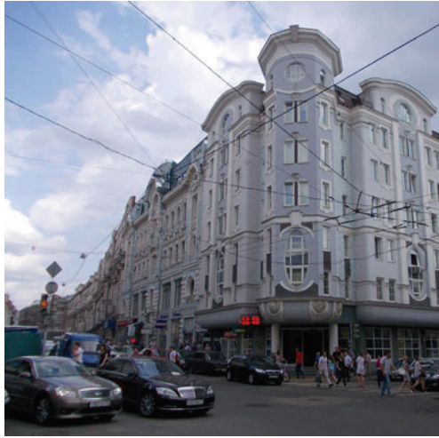
13. sz. fotó

Álszeccesiós stílusú épület a Mjasznyickaja 16. alatt, ahol korábban a Szokolov-féle bérház állt.