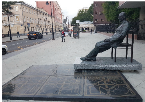
24. számú fotó

Le Corbusier szobra az általa tervezett épület előtt.