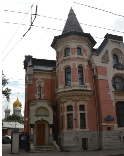
10. sz. fotó Kekusev háza az Osztuzsenkán (21. sz.).