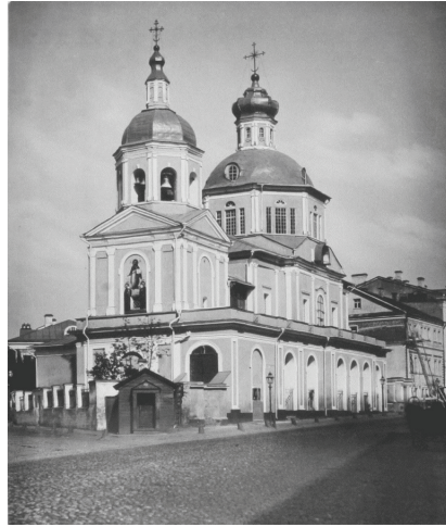
1. sz. fotó

тельство Москвы) folyóiratban olvashatjuk azt, hogy a Gépipari Gyári Állami Egyesület Központi Igazgatósága kezdeményezésére ezen a helyen épül fel a kilencemeletes Trösztök Palotája. Természetesen, ahogy sok más is, ez sem épült meg, viszont sokévi huzavona után, már a rendszerváltás utáni időben emeltek itt egy historizáló épületet, nem lényeges, hogy milyen oktatási intézmény számára (vö. a 2. sz. fotóval).