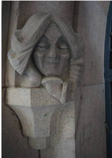
17. sz. fotó