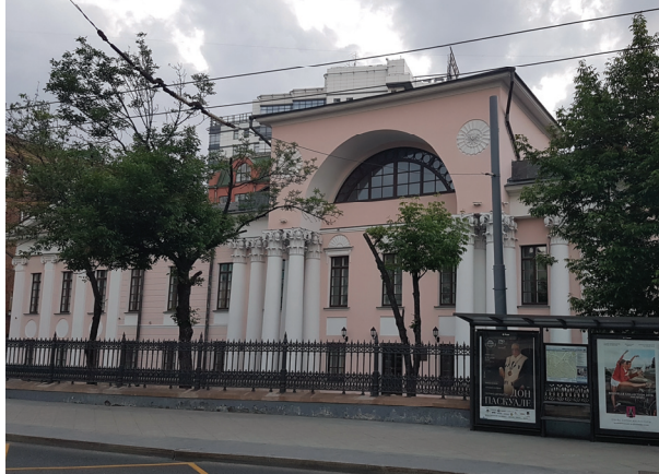
25. számú fotó