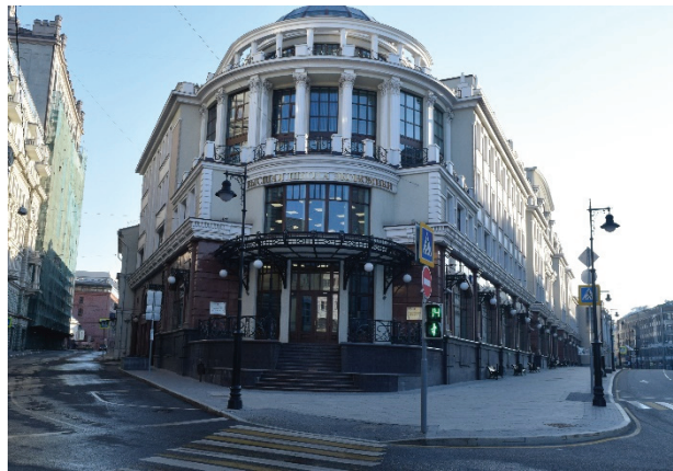
2. sz. fotó

A szent Euplus (Eupliusz) tiszteletére épült templom.