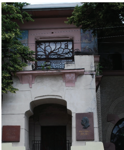
12. sz. fotó

Rjabusinszkij villa. Malaja Nyikitszkaja (6/2. sz.).