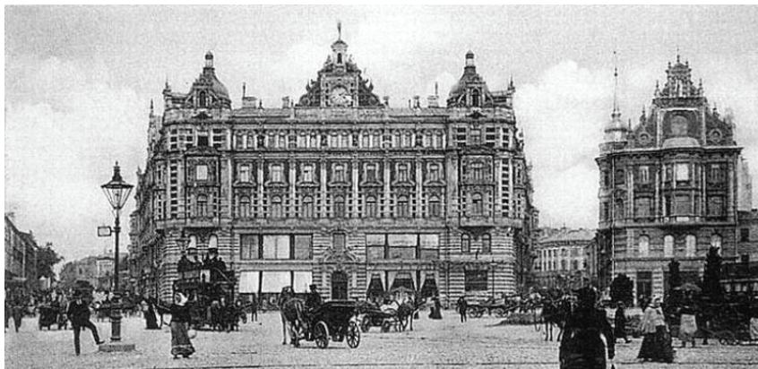
6. sz. fotó

A Mjasznyickaja utca számozása a Kitaj-gorod, a Ljubljanka tér felől kezdődik (a legtöbb ház számozását lásd a cikk végén). Az utca torkolatánál álló, bejáratukkal a tér felé néző épületek a hosszú évtizedek alatt – s napjainkban is – a szovjet, majd orosz biztonsági szervek központja(i)nak adnak helyet. Ezek a forradalom előtt az orosz főváros urbanisztikai szempontból egyik kiválóan megtervezett és átgondoltan megalkotott terén álltak. A forradalom előtt a tér lezárásaként az „Oroszország” nevű biztosítótársaság székháza uralta a látványt. A 20-as években az akkor divatos konstruktivizmus jegyében az épülethez még csak hozzáépítettek néhány szárnyat, de a 70-es években – már a brezsnyevi időkben – a felismerhetetlenségig átalakították (vö. 6. és 7. sz. fotókat). Már csak a homlokzati óra, illetve a jobb oldalon álló épület meghagyott homlokzata emlékeztet a régire. A módszer egyébként nem orosz, bőven van rá példa Ottawától Manhattanig (vö. Hearst Tower, New York és Ottawa ON-Bank of Canada), az ún. brüsszelizációról (Bruxellisation) nem is beszélve.