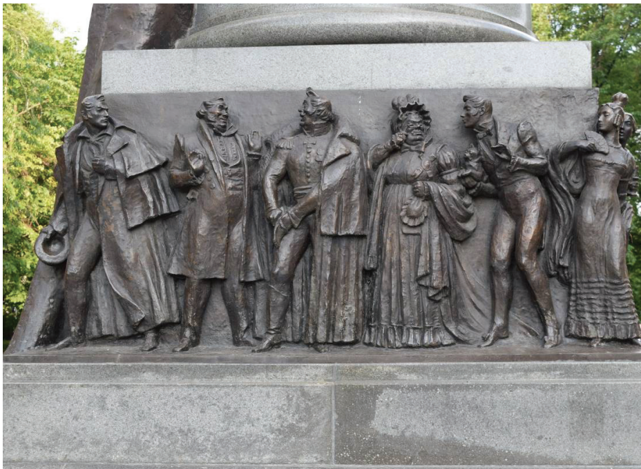
22. számú fotó

A Mjasznyickaja utca 42. sz. alatti házat a 19. század elején építette Ivan Ivanovics Barisnyikov, nyugalmazott őrnagy, egyben gazdag föld- és gyártulajdonos. A klasszicista stílusban épült palotát megkímélte az 1812-es tűzvész, de a francia katonák