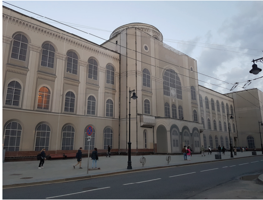
15. sz. fotó

zata megtévesztő hűséggel jelzi és ábrázolja a mögötte lévő, rekonstrukció alatt álló épületet (vö. a 15. sz. fotóval). Nem ez az egyetlen postája az utcának.