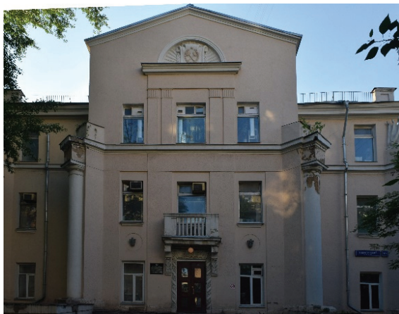
4. sz. fotó

A lengyel Szent-Péter-Pál-templom 1940 körül.