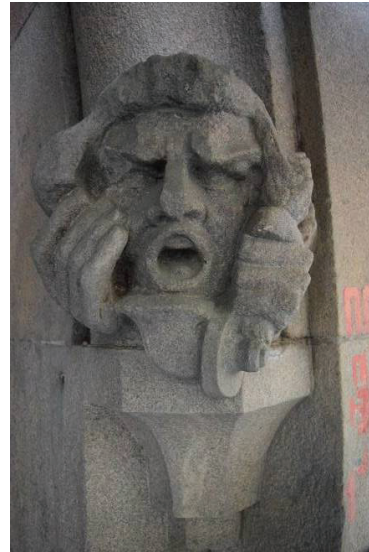
18. sz. fotó