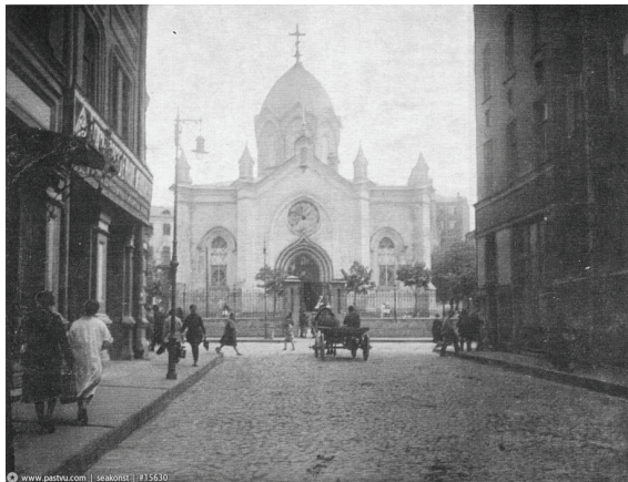
3. sz. fotó

Így lett az utca templomtalaná, ami még a sztálini és hrucsovi templomrombolást tekintve is szokatlan jelenség Moszkvában. Azaz mégsem. Maradt templom „épületügyileg”, de csak a jó szemű szemiotikus számára (lásd a 3. és 4. sz. fotókat).