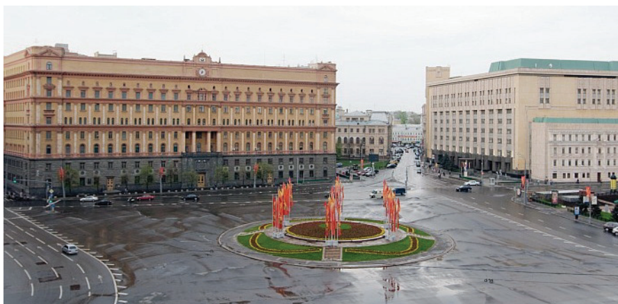
7. sz. fotó

Balról az Orosz Biztonsági Szolgálat (FSZB) átépített és megtoldott épülete. Magasságát két emelettel növelték meg. A hátsó feléhez konstruktivista épületszárnyat toldottak. Jobbról a biztonsági szolgálat számítóközpontja.