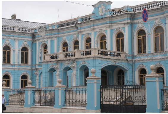
8. sz. fotó