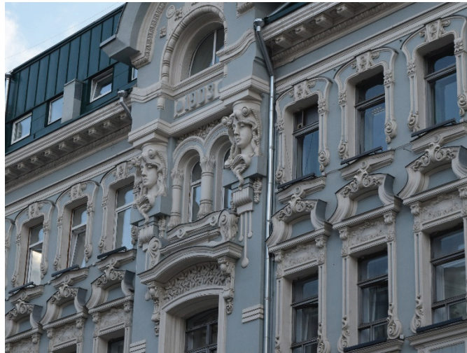
14. sz. fotó

Álszeccesiós stílusú épület a Mjasznyickaja 16. alatt, ahol korábban a Szokolov-féle bérház állt.