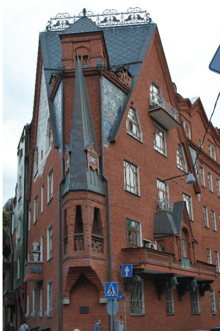
11. sz. fotó Percov háza. Kurszovoj köz (1. sz.).