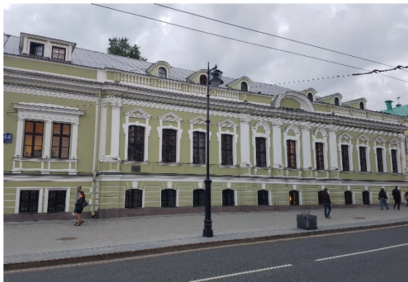
26. számú fotó