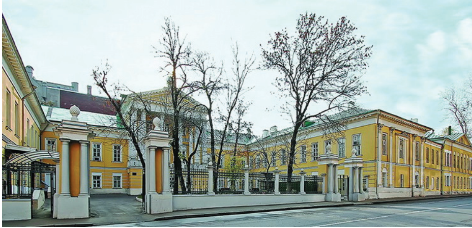
21. számú fotó