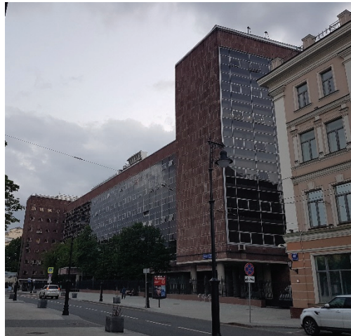
23. számú fotó