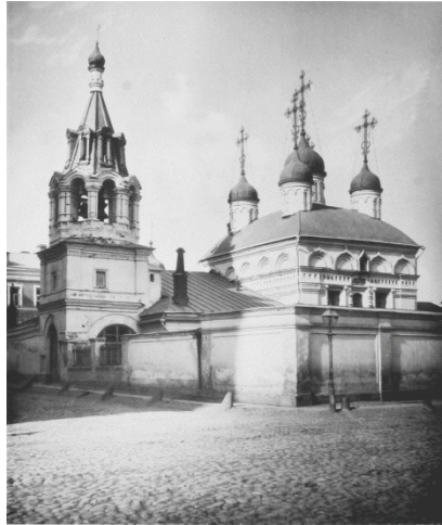
5. sz. fotó

Szent Florus és Laurus vértanúknak szentelt templomról.