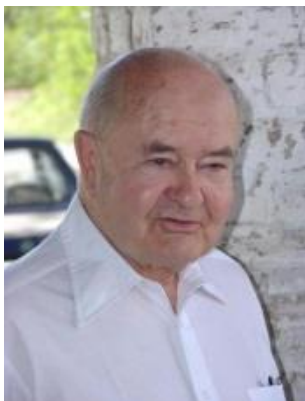
Bor Pál (1919–2004)